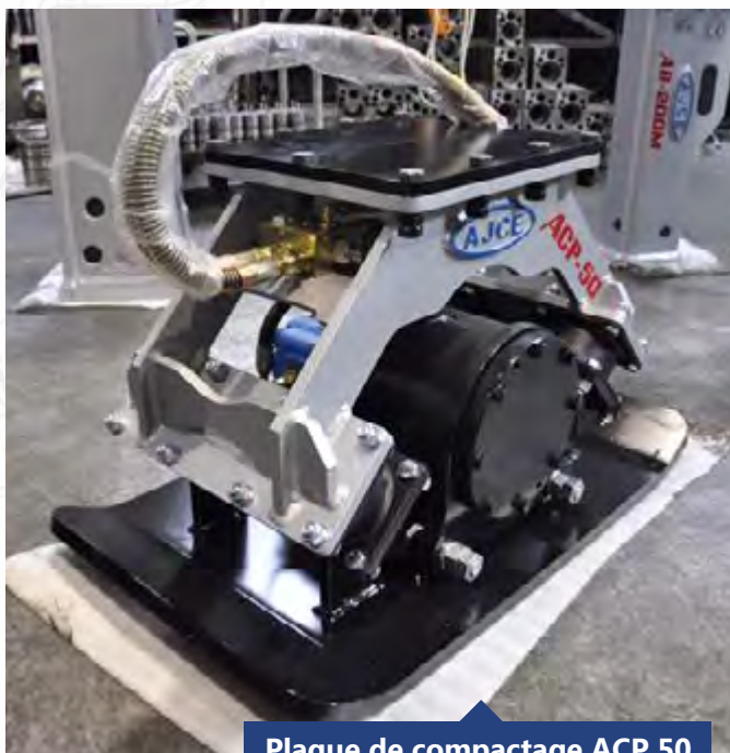
Plaque de compactage ACP 50